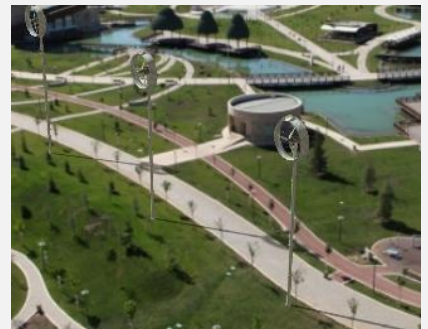
Park ve Bahçeler